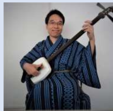
三味線（レバオゴックさん）